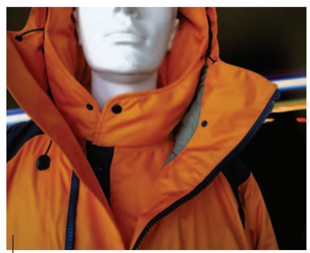
"Quota Zero", giaccone per alta quota

complementari - dalla chimica all'ingegneria meccanica ed aerospaziale, dalla tecnologia tessile al design di prodotto - GZE offre un servizio di progettazione a 360°, dallo sviluppo dell'idea alla prototipazione, fino alla messa a punto finale. Attraverso le proprie divisioni - Gze Ricerca e Sviluppo, Gze Disegno Industriale, Gze Prototipazione Rapida, Gze Ingegneria, Gze Tessile e Gze Laboratorio - l'azienda si identifica con l'attività di ricerca avvalendosi di una squadra fortemente variegata, funzionale a quell'approccio multidisciplinare che costituisce la vera essenza di GZe. Le applicazioni dei nuovi materiali spaziano dallo sport all'arredamento: dai tessuti autostiranti e ultraleggeri ai trattamenti termoisolanti, dalla rivalutazione di fibre naturali non più utilizzate a nuovi sistemi di illuminazione, fino ai trattamenti protettivi per pelle e tessuti. Rimane di prioritaria importanza la realizzazione in proprio di prodotti "sintesi", simbolo di una ricerca concreta e tangibile, commercializzati attraverso il web store aziendale www.gzespace.com : fra questi il giaccone per alpinismo Quota Zero, il giubbotto da moto LQ Jacket, il passamontagna K-Cap.