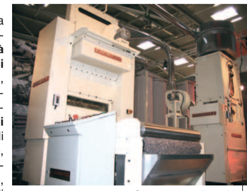
Systema Lap FormAir

Le eccezionali prestazioni della macchina di Cormatex si caratterizzano soprattutto per la possibilità di processare qualsiasi tipo di materiale, fibroso e non fibroso, valorizzando materiali poveri e prodotti di scarto di altri processi industriali, solitamente non impiegate nell'industria tessile (quali fibre di canna da zucchero, fibre di cocco, cotone rigenerato, iuta e lino rigenerati, canapa grezza, carta e cartone, o addirittura cascami di processi di cardatura tradizionali, materiali di scarto della produzione di tappeti, scarti di alcuni processi di nobilitazione tessile). La sperimentazione di nuovi materiali è tutt'ora in corso grazie ad una linea pilota a completa disposizione della clientela realizzata da Cormatex presso la propria sede di Prato.