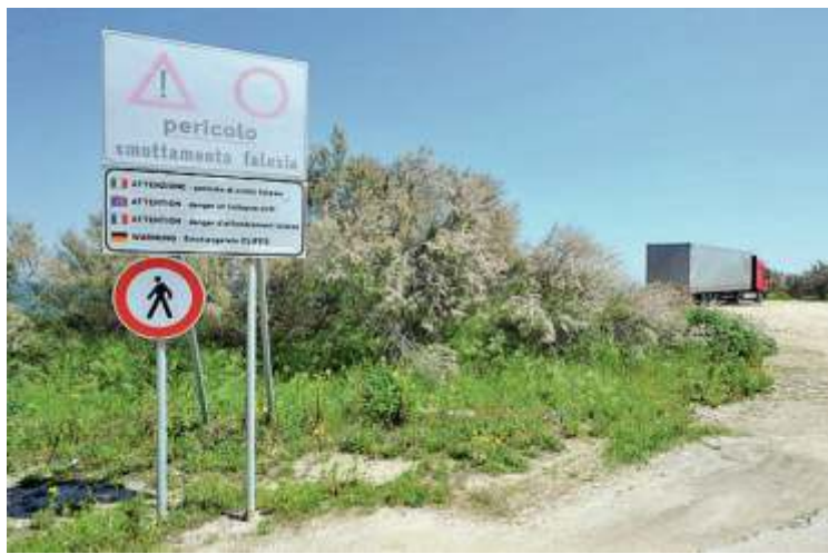
Il pericolo I cartelli che avvisano del rischio crolli sulla falesia

L'area interessata va da San Foca fino a Torre Specchia. Le indagini dopo il sequestro della Capitaneria